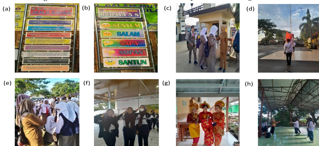
Gambar 1. (a) Simbol Janji Peserta didik yang terdapat di lingkungan SMA Negeri 10 Palembang, (b) Simbol Budaya 5S di lingkungan SMA Negeri 10 Palembang, (c) Penerapan budaya 5S di SMA Negeri 10 Palembang, (d) Apel setiap pagi SMA Negeri 10 Palembang, (e) Simbol ekstrakurikuler PML di SMA Negeri 10 Palembang, (f) Kegiatan ekstrakurikuler lainnya, (g) Pertunjukan budaya, (h) Kegiatan ekstrakurikuler lainnya.

Hasil dari observasi dan angket yang dilakukan selama PPL di SMA 10 Palembang dan menganalisis lima artikel mengenai penghayatan dan penghargaan identitas manusia di lingkungan sekolah bahwa didapatkan data sebagai berikut: