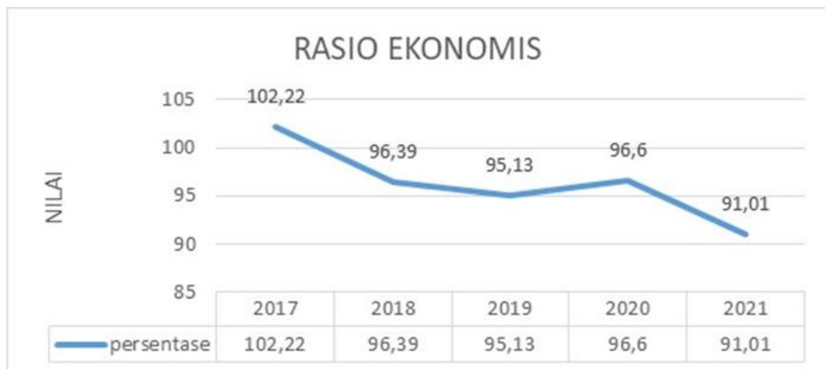
Gambar 1 Grafik Perkembangan Rasio Ekonomis Pemerintah Kabupaten Lombok Timur Tahun Anggaran 2017-2021

Pengukuran Kinerja ekonomi dapat dilihat dari tabel di bawah ini: