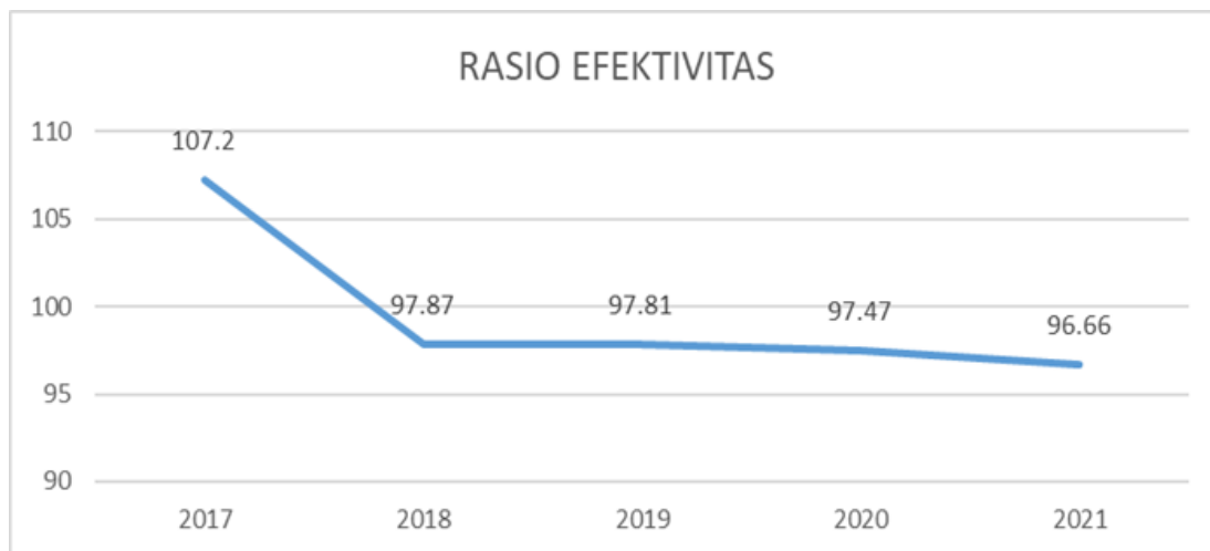
Gambar 3 Grafik Perkembangan Rasio Efektivitas Pemerintah Kabupaten Lombok Timur Tahun Anggaran 2017-2021

Berdasarkan Gambar 3 menunjukkan bahwa terjadi penurunan pada rasio efektivitas. Rasio efektivitas untuk tahun anggaran 2017 sampai dengan 2018 mengalami penurunan sebesar 9,33% yang menyebabkan rasio efektivitas berada dalam kategori efektif. Tahun anggaran 2018 sampai dengan 2019 mengalami penurunan sebesar 0,06% dan berada dalam kategori efektif. Tahun anggaran 2019 sampai dengan 2020 mengalami penurunan sebesar 0,34% termasuk dalam kategori efektif. Tahun